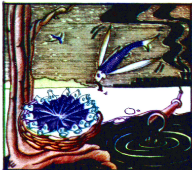
Рис. В. ХАХАНОВА и Н. ШАРАПОВА.